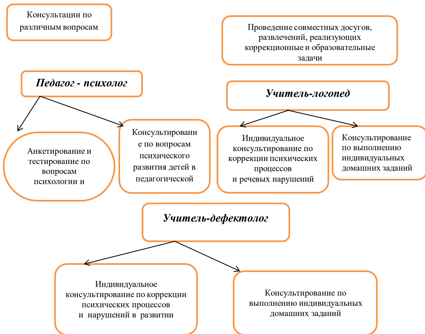
Рис. 1 «Схема взаимодействия с семьями воспитанников»