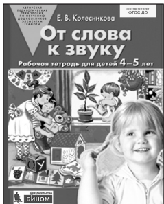
«От слова к звуку». Рабочая тетрадь для детей 4-5 лет