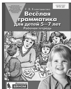
«Веселая грамматика для детей 5–7 лет». Рабочая тетрадь