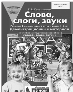
«Слова, слоги, звуки». Демонстрационный материал для занятий с детьми 4-5 лет