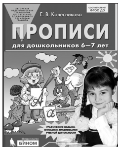
«Прописи для дошкольников 6–7 лет»