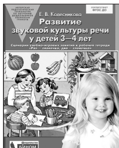
«Развитие звуковой культуры речи у детей 3–4 лет». Учебно-методическое пособие