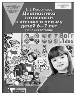
«Диагностика готовности к чтению и письму детей 6–7 лет». Рабочая тетрадь