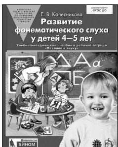
«Развитие фонематического слуха у детей 4–5 лет». Учебно-методическое пособие