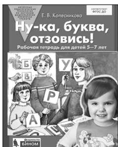
«Ну-ка, буква, отзовись!» Рабочая тетрадь для детей 5–7 лет