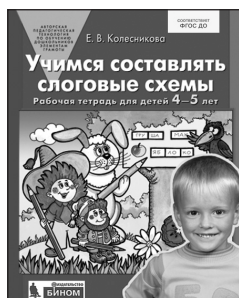
«Учимся составлять слоговые схемы». Рабочая тетрадь для детей 4–5 лет

Используйте данные пособия только после того, как закончите обучение детей по книгам основного комплекта.