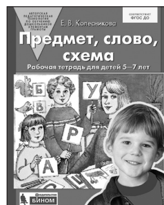
«Предмет, слово, схема». Рабочая тетрадь для детей 5–7 лет