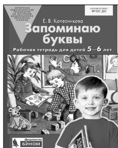
«Запоминаю буквы». Рабочая тетрадь для детей 5–6 лет