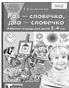
«Раз — словечко, два — словечко». Рабочая тетрадь для детей 3-4 лет